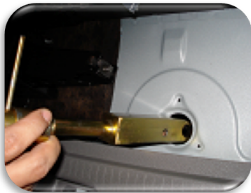
Foto 1 Retirar o conjunto original e colocar o novo conjunto conforme indicado.

Em caso de perda da chave, o código para adquirir uma nova, está gravado no dispositivo com letra e número.