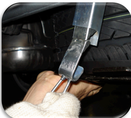
Foto 5 mostra como posicionar o "pescador" para retirar o estepe. Atenção: suspender o estepe com a mão esquerda e com a mão direita girar o pescador para a esquerda liberando a bandeja.

As fotos 3 e 4 mostram detalhe do estepe sendo recolhido.