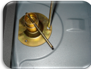
Foto 2 Parafusar o conjunto Obs: detalhe da chave que aciona o sistema na posição