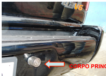
Detalhe externo do anti furto instalado na Blazer